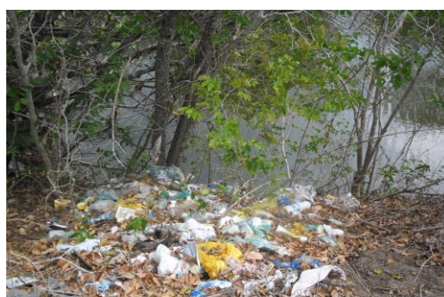
Foto 02: Lixo doméstico na margem do Rio Coruripe.

Durante as visitas aos sítios ribeirinhos especificamente no Sitio Cabaços, foi identificado um forte impacto ambiental. O proprietário da área marginal do rio em pauta, para ampliar sua atividade de pecuária extensiva provocou o desmatamento do fragmento de mata ciliar ainda existente no local. Nesse aspecto Franco (2005, pp.131-132) contribui com o texto na discussão de que: